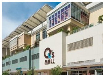
阿倍野Q's Mall (於天王寺站前站下車)