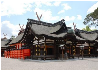
住吉大社 (於住吉站下車)