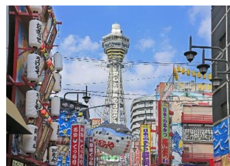
通天閣 (步行約14分鐘)