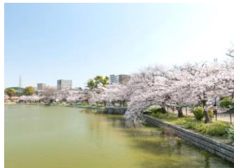
萬代池公園 (於帝塚山三丁目站下車)